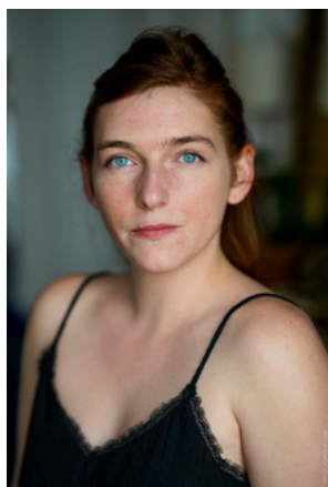
Écriture et jeu