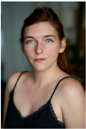
Écriture et jeu

Elle cultive depuis son plus jeune âge un goût accru pour l'observation du genre humain. Après l'école obligatoire, elle intègre la scène-sur-Saône à Lyon, Ecole d'art dramatique, où elle suit en fin de cursus la formation FRACO, dédiée à l'acteur comique, qui confirme son affinité avec l'humour et l'excentricité. Elle se forme avec différents spécialistes en la matière: au clown et au bouffon avec Eric Blouet, Adell Nodé-Langlois, Heinz Lorenzen, Tommy Luminet puis au jeu burlesque et accidenté avec Norbert Abouharham, François Herpeux, Elise Ouvrier-Bufferet & Louis Grison. Elle oeuvre aussi dans d'autres domaines comme la marionnette ou le Théâtre performatif pour l'espace public (L'air du Temps, Cie Les Marmalins, Cie Systèmes K). Elle prend l'initiative, en mars 2022, de créer la Cie Mouche à Mouche et entame l'écriture du spectacle "Comme tout le monde".